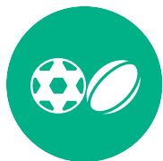
တၢ်မၤလိဒီးတၢ်ဟူး တၢ်ဂဲၤတဖၣ်