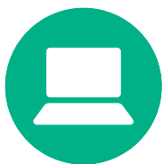
လဲးဖထီးဒီးထဲးဘလဲး

မ့ၢ်စ့ $500 အံၤတၢ်သူအါလၢမနုၤအဂီၢ်သ့လဲၣ်.