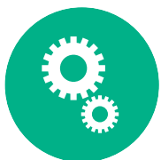
တၢ်လုၢ်အိၣ်သး သမုအတၢ်ကူၣ်ဘၣ်ကူၣ်သ့