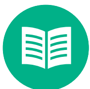
လိာ်လဲၢ်ဒီးတၢ်သူတၢ်စွဲတဖၣ်