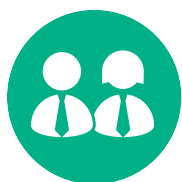
ယူနီၣ်ဖီ(န)ဒီးခိၣ်ဖဲးတဖၣ်